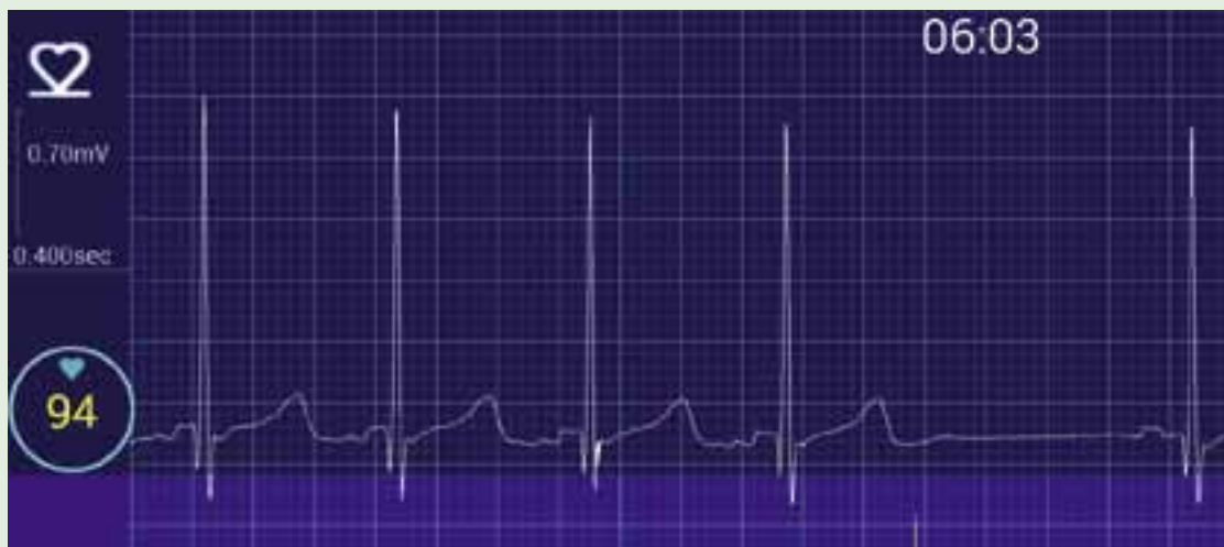
Kuva 2. Ka-peakompleksisessa takykardiapyrähdyksessä eteisaktiiviteetin signaali eroaa sinuslyönnin P-aalosta.

dollistavat pitkäaikaisen seurannan. Tutkimustulokset vaikuttavat lupaavilta mm. eteisvärinän ja kammioperäisten rytmihäiriöiden tunnistamisessa (11). Myös älyvaatteisiin ja jopa autoihin on kehitetty sydämen sähköisten tapahtumia rekisteröiviä laitteita. Toteutuksia on viljalti, ja seuraavassa esitellään lyhyesti muutamia Suomessa markkinoilla tai kehitteillä olevia ratkaisuja rytmihäiriöiden diagnostiikkaan.